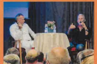
A művelődési ház hírei