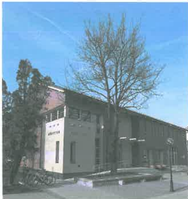
Könyvtár, Herceghalom (iskola bővítés)