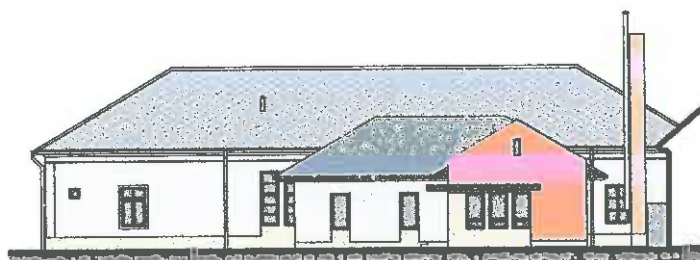
Óvoda bővítés, Alcsútdoboz