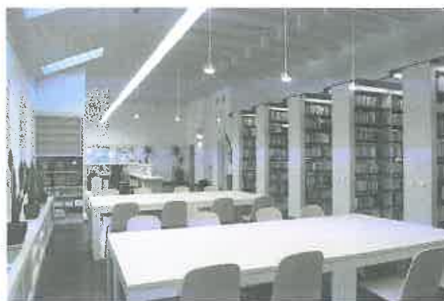
Könyvtár, Herceghalom (iskola bővítés)