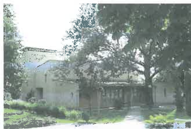
Ökumenikus templom, Herceghalom