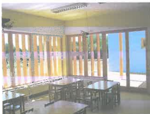
Óvoda, Szár, csoportszoba